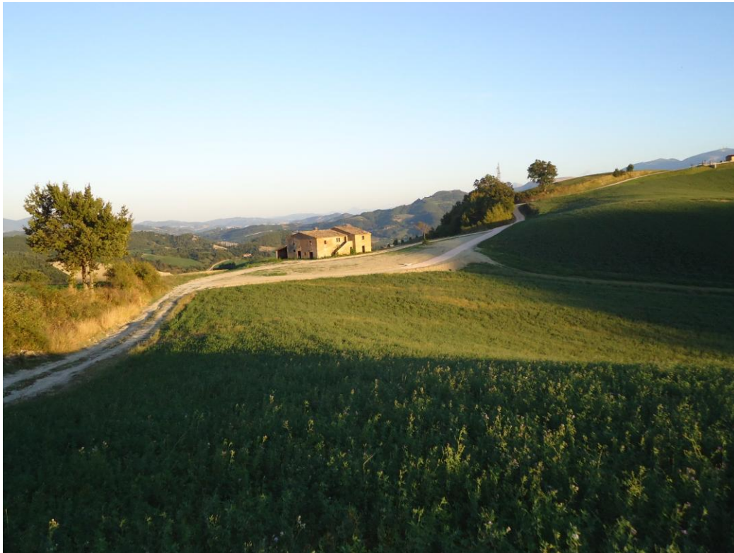
Vista lato nord-ovest, panoramica - 5