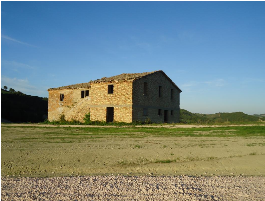
Vista lato sud-ovest, annessi che verranno demoliti - 3