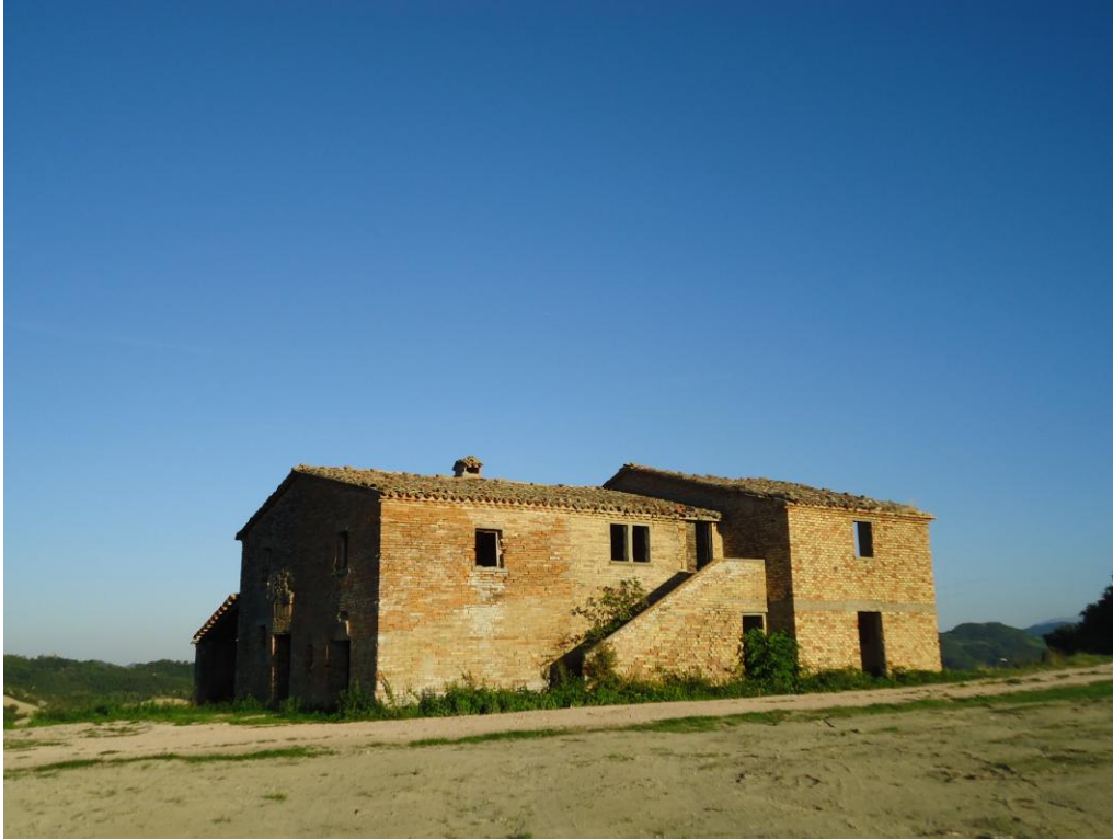
Vista lato scala di ingresso - 1