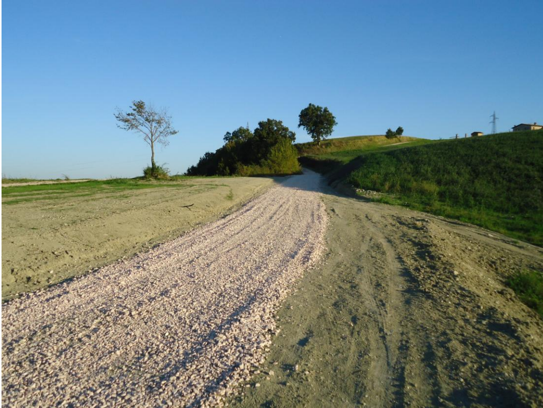
Vista panoramica di accesso al sito - 7