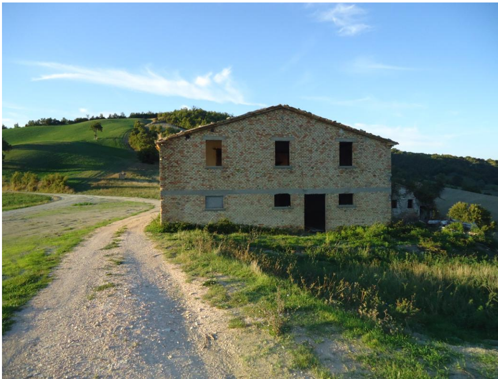
Vista lato sud, annessi che verranno demoliti - 2