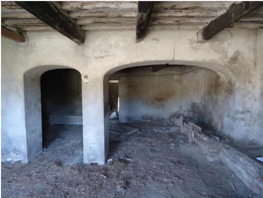
Vista interna del piano terra - 8