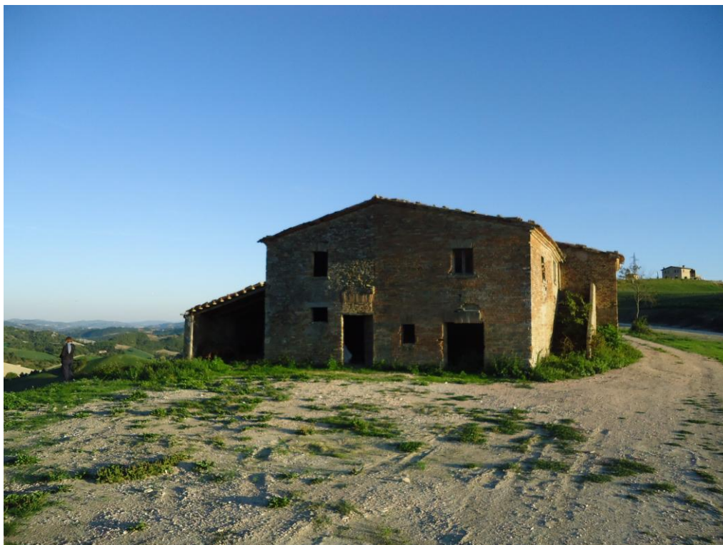
Vista lato nord, edificio da restaurare - 4