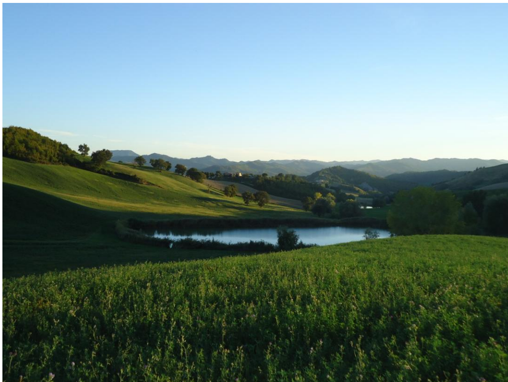
Vista lato nord-est, panoramica sul laghetto - 6